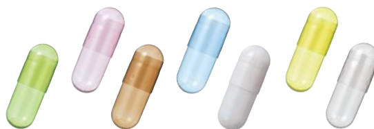
Plantcaps カプセル サイズ構成

植物由来カプセルの優れた特性はそのままに、市場において 他社商品との差別化やブランド向上に貢献します。 色素表示に関しては、弊社までお問い合わせください。